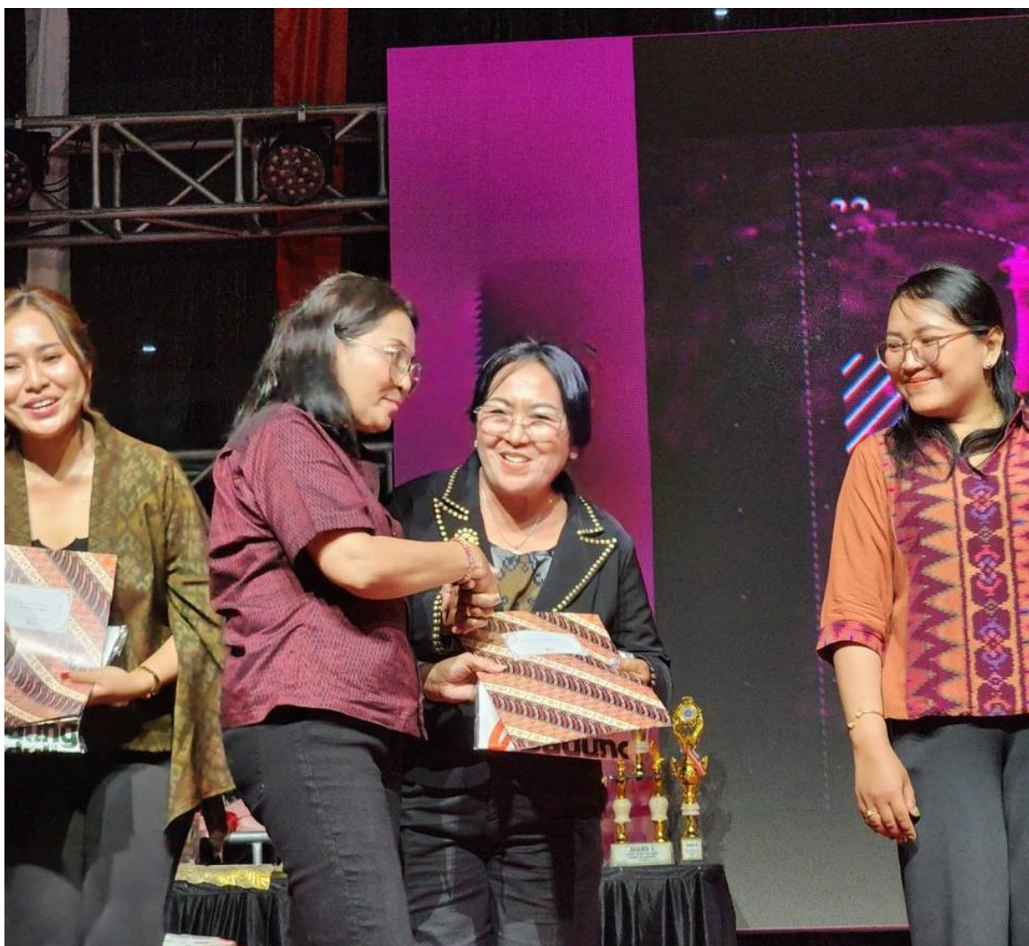
Lomba Ibu Inspiratif Kategori Pejuang Ekonomi Dalam Rangka Perayaan Hari Ibu Kabupaten Badung Tahun 2025