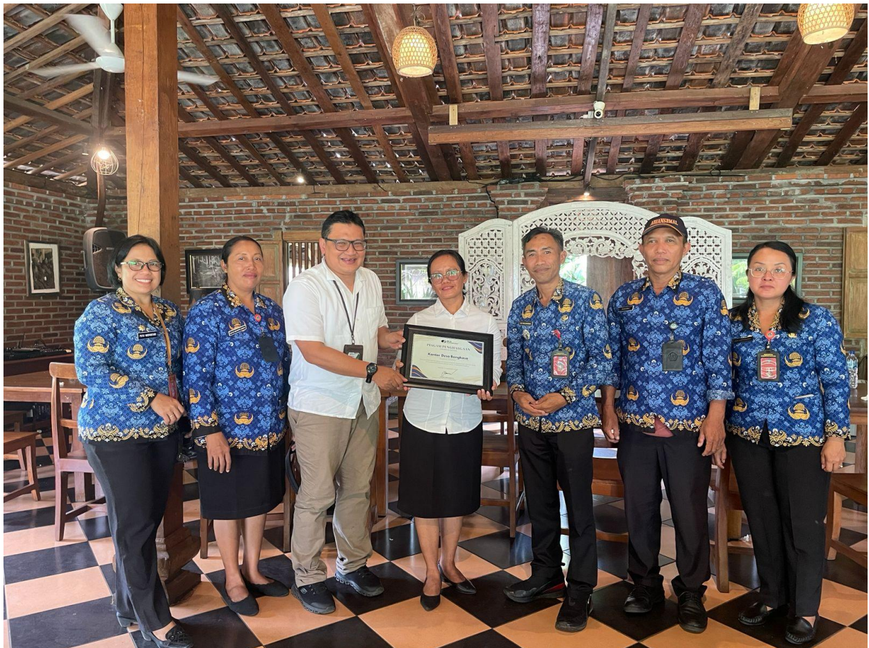
Apresiasi Atas Kontribusi Optimal pada Program BPJS Ketenagakerjaan Tahun 2025