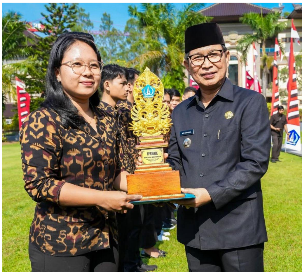
Juara 1 Pemuda Pelopor Desa Bidang Pendidikan Tingkat Provinsi Bali dan Kabupaten Badung Tahun 2025